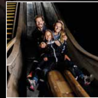
두 번째 미끄럼틀